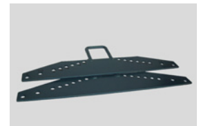
3" Ober- u. Unterplatte