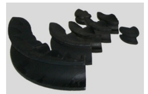
1/2" - 3" Biegesegmente