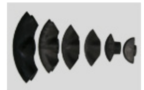
1/2" - 2" Biegesegmente