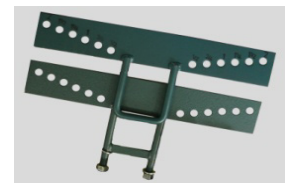
2" Ober- u. Unterplatte